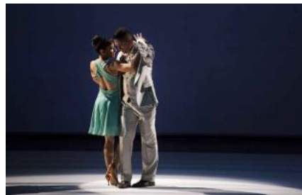
Una imagen del espectáculo "Sazón" de SÓLODOS.